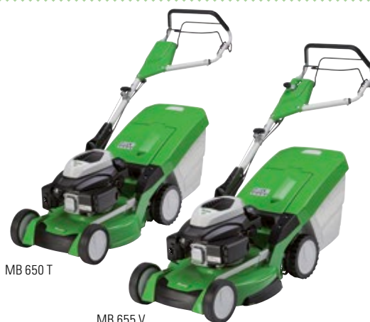
MB 650 T